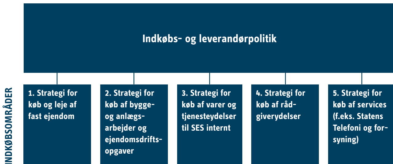
Figur 2: Indkøbspolitik og indkøbsstrategier

Indkøbs- og leverandørpolitikken suppleres af fem indkøbsstrategier, der fastlægger rammer, målsætninger og fokuspunkter for hvert enkelt indkøbsområde, jf. figur 2 nedenfor: